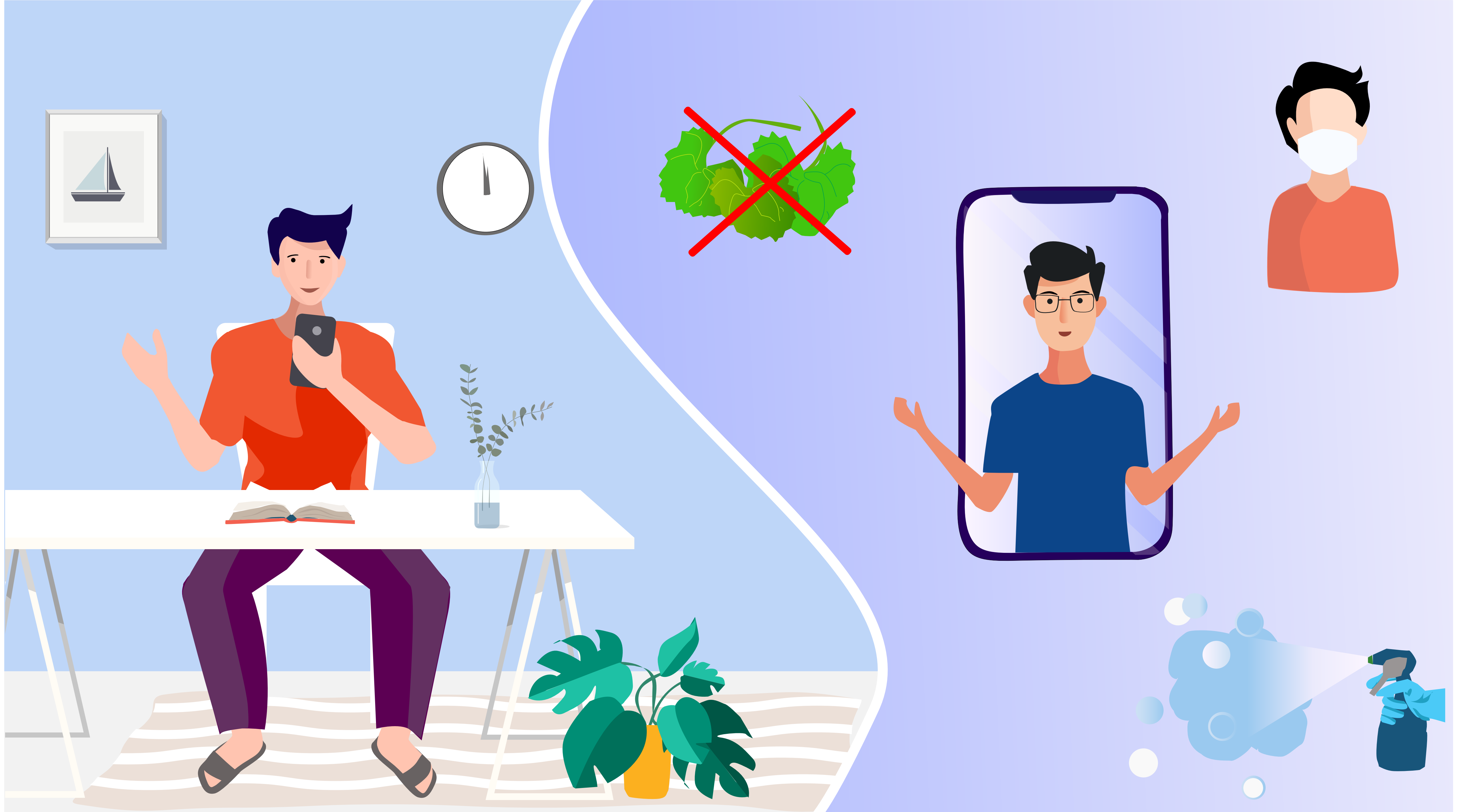
নিজে সাবধান হউন এবং অন্যকে সহায়তা করুন